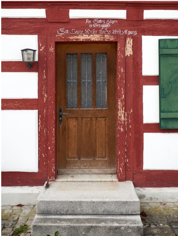
Abbildung 1: Spruch Ostfassade

Mit Recht darf Hemishofen das schönste Schulhaus des Kantons, was sein Äusseres betrifft, für sich beanspruchen. An der aus eichenem Fachwerk bestehenden Ostfassade kann man der Tür den Spruch lesen: "an Gottes Sägen ist alles glägen. Gott segne unser aller In- und Ussgang." Die Schrift lässt ein ehrwürdiges Alter vermuten. Lange war man über das genaue Baudatum im Ungewissen, bis Stadtarchivar Max Ambühl auf eine Notiz stiess, wonach der Bau 1660 erfolgte. Nach vielen Jahrhunderten regem Schulbetrieb musste im Sommer 2021 mangels Schüler der ursprüngliche Zweck des Schulhauses aufgegeben werden. Zurück blieb ein leeres Schulhaus.