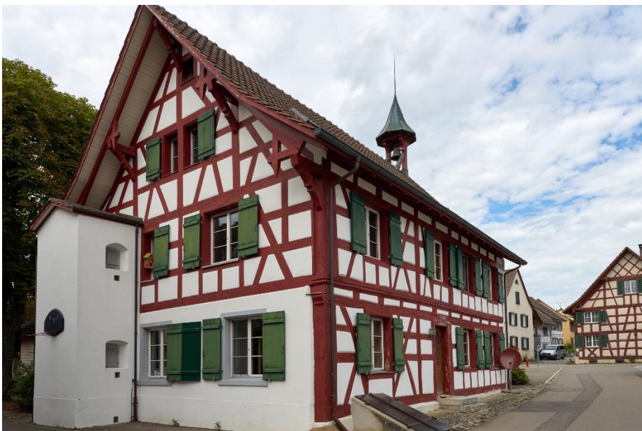
Abbildung 3: Aussenansicht Schulhaus, Ost- und Nordfassade