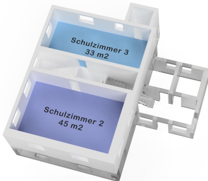
Abbildung 5: Raumplan Obergeschoss mit zwei vermietbaren Räumen

Im Obergeschoss befinden sich zwei Räume, die vermietet werden und lediglich einer sanften Renovation und Elektroinstallation bedürfen. Die neue Raumplanung im Obergeschoss ist auf der folgenden Abbildung visualisiert.