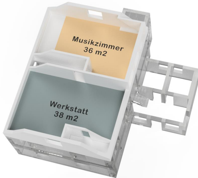
Abbildung 6: Raumplan Dachgeschoss mit Werkraum und vermietbarer Raum

Im Dachgeschoss befindet sich ein kleiner Werkraum und ein weiterer, vermietbarer Raum, das ehemalige Musikzimmer. Die Umbauarbeiten fokussieren sich hier vor allem darauf, den Fluchtweg durch das Treppenhaus vom Dachgeschoss zum Obergeschoss gemäss Feuerpolizei brandsicher auszustatten.